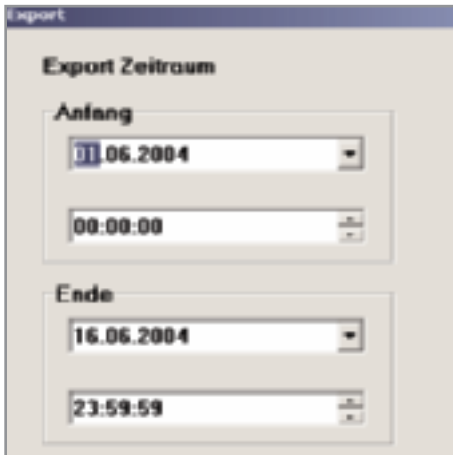
SG2 versión Profesional