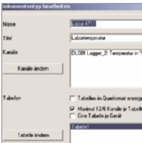
SG2 versión Pharma

Mejoras gratuitas para SmartGraph2 estándar Activación de las versiones Profesional y Pharma mediante llave con código Selección de muchas lenguas